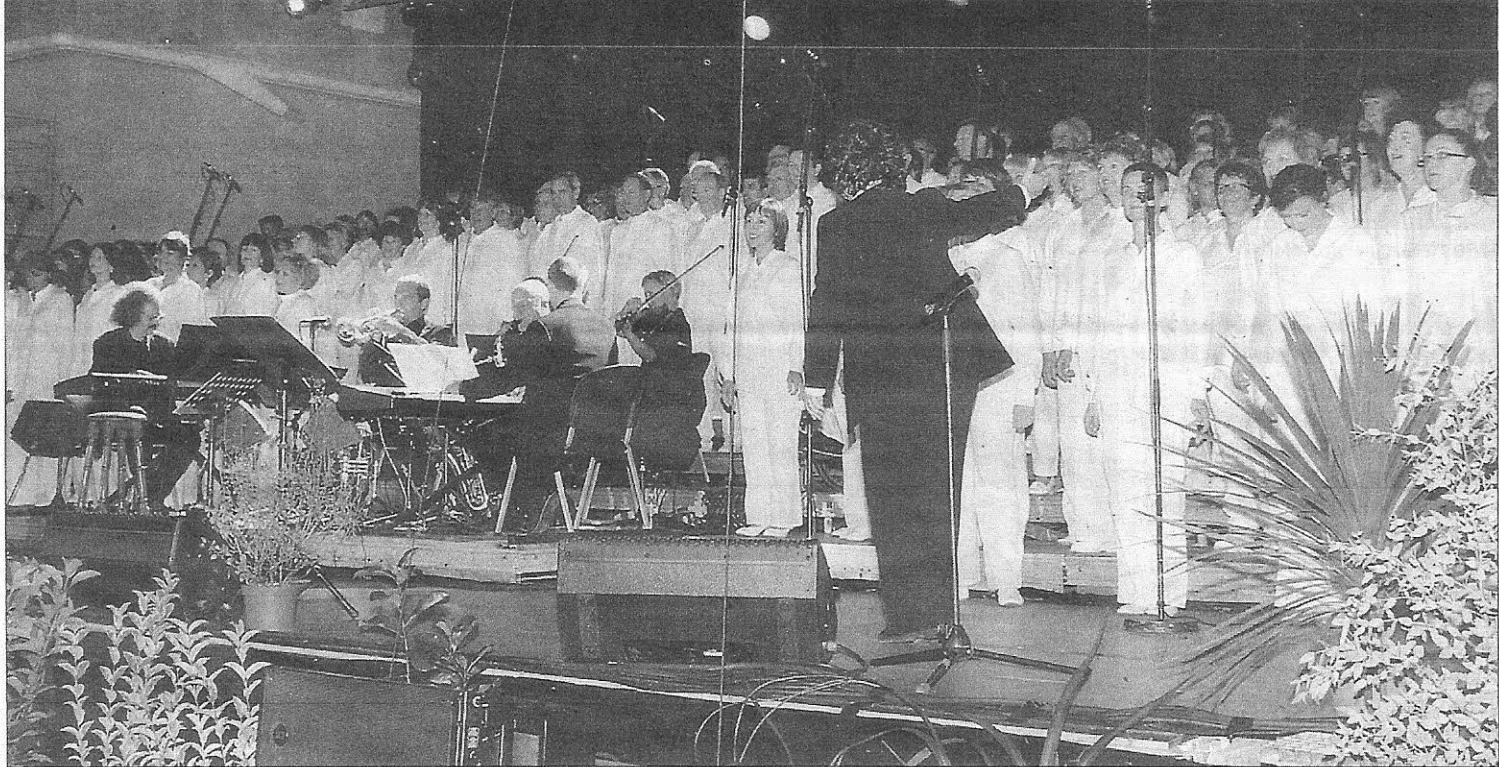
Les Chœurs de France Aquitaine étaient déjà venus à l'Espace Claude-Nougaro en octobre 2012.